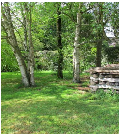
Figure 1. Site de l'observation.

Le 24 avril 2014, à la nuit tombante, un piège de type Tavoillot équipé d'une ampoule lumière noire 20 watts y est installé, non loin d'un bosquet constitué de six bouleaux plantés dans les années 70, d'un charme, d'un pin et d'un épicéa (Fig. 1).