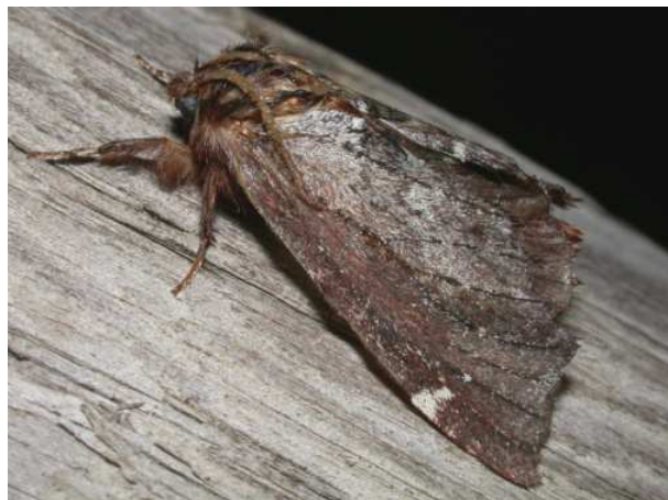
Figure 2. Odontosia carmelita.

Voilà donc plus de cinq ans que cette espèce, pourtant non migratrice, dédaigne les nombreux piègeages lumineux réalisés en Basse-Normandie dans le cadre de l'Atlas Macrohétérocères. En consultant l'incontournable site Lépi'net (Lépi'net, 2014), on constate que la Carmélite n'est pas présente dans les départements limitrophes et qu'il s'agit d'une nouveauté pour l'Ouest de la France (Fig. 3).