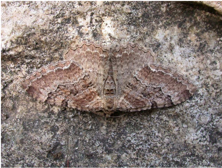
Figure 1. Hydria cervinalis.

SKINNER B., 1998.- Colour identification Guide to Moths of British Isles . 2ème édition. Viking edition, Londres. 267 p.