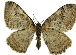
Figure 3. Spécimen prélevé à Caligny.