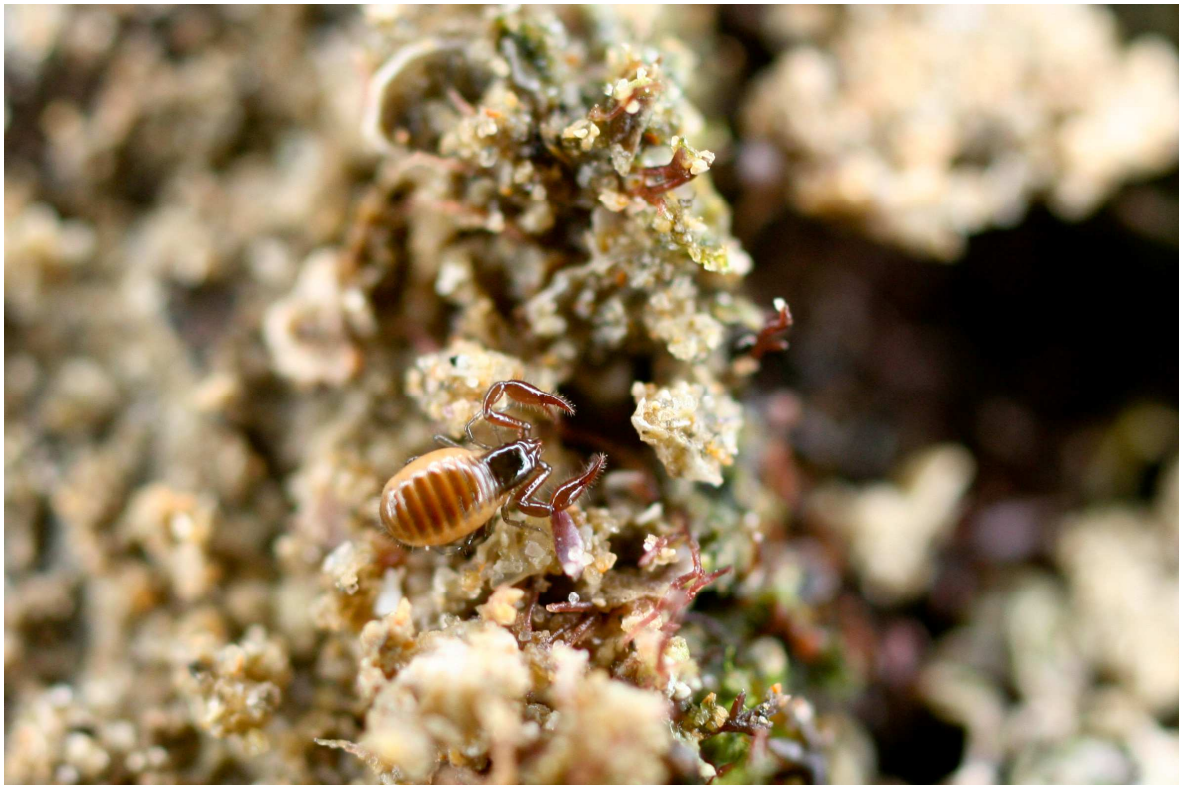
Figure1. Neobisium maritimum (Cliché : E. Ollivier).

Son régime alimentaire est principalement constitué, selon BAGNALL (1907) et KEW (1910), du collembole Anurida maritima (Guérin-Méneville, 1806), lui aussi inféodé aux estrans rocheux. Mais, comme certains de ses congénères terrestres, il est possible qu'elle se nourrisse aussi d'acariens, très abondants dans ce milieu.