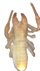
Figure 3. Chthonius halberti.

Son écologie exacte est encore mal connue mais elle pourrait s'apparenter à celle d' Aepus marinus (Strøm, 1788), un coléoptère Carabidae lui aussi présent sous les pierres sur substrat sableux. L'habitat particulier de Chthonius (Chthonius) halberti et le faible nombre d'arachnologues expliquent aussi certainement son statut de rareté.