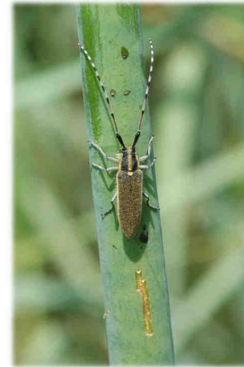
Agapanthia asphodeli (LATREILLE, 1804) sur Asphodelus sp.

En souhaitant que ces documents vous aident dans vos recherches.